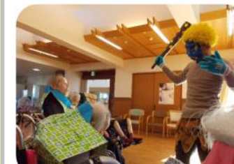
みんなで豆を撒いて 鬼を退治!