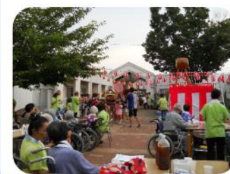
年に一度の夏祭り。 とっても盛り上がります!