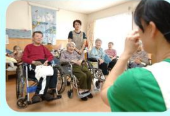
コミュニティールーム ⑧