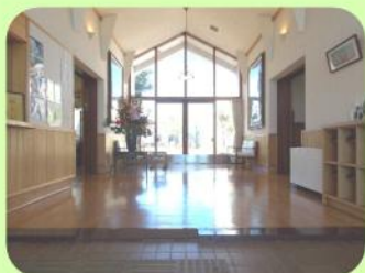
エントランスホール ④