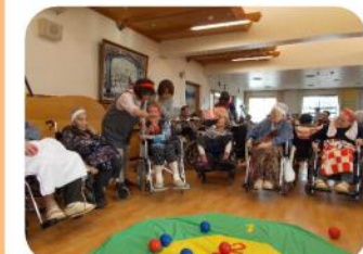
秋の運動会 みんなで一緒に 頑張ります!